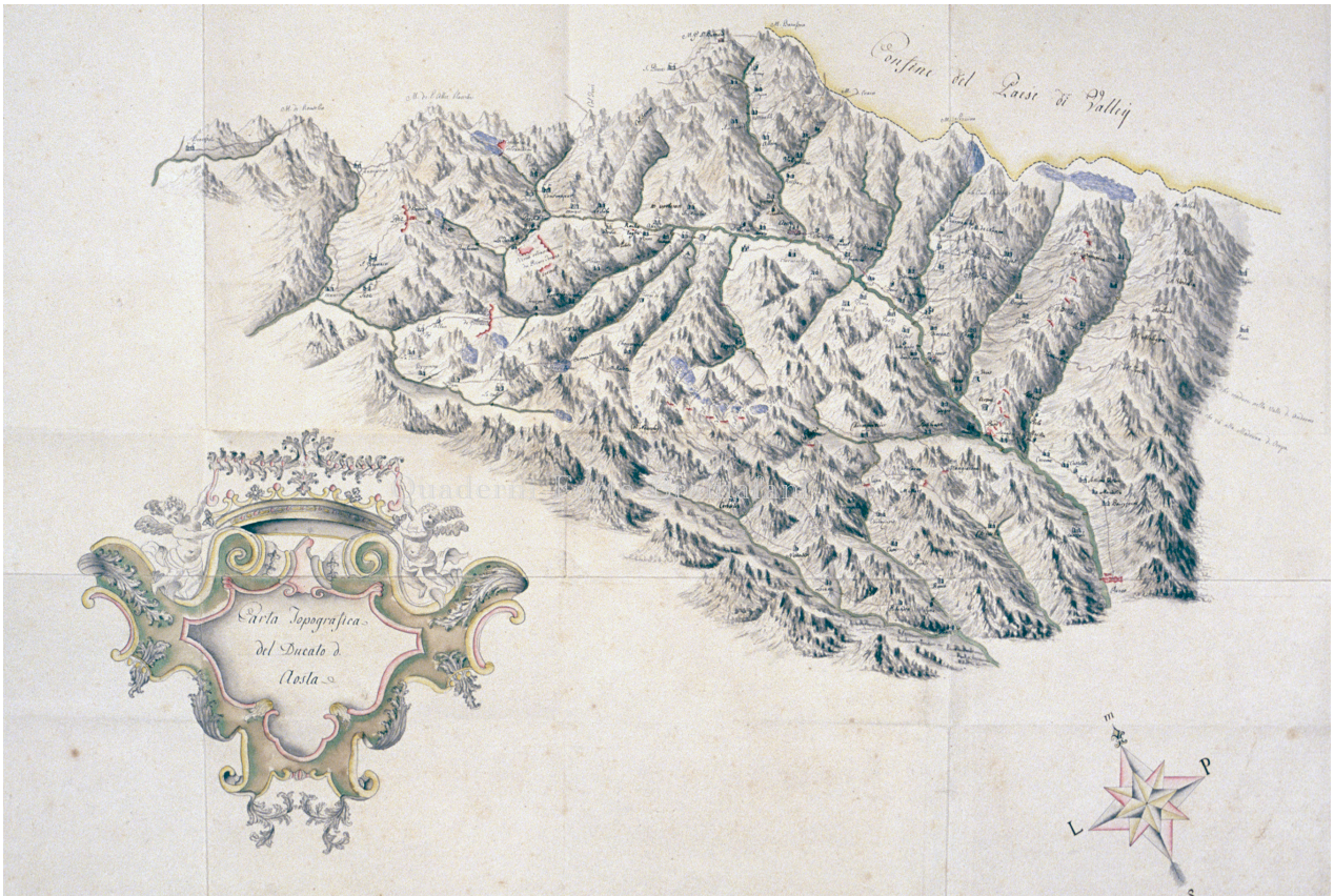
Carta Topografica del Ducato d'Aosta. BRT Ms STP 524.

1773 ed il 1785. Il figlio probabilmente svolse il ruolo di assistente-ispettore sottoposto anche nel grado al genitore, cui era stato affidato ufficialmente l'incarico di stendere le relazioni. Di queste ultime non vi è traccia ufficiale, a meno di non prendere in considerazione una relazione anonima presente anch'essa nel Mazzo 13 (essa sarebbe quindi databile tra il 1773 ed il 1785 e curata da entrambi), oppure procedere ad un'accurata ricerca d'archivio su eventuali altre relazioni anonime.