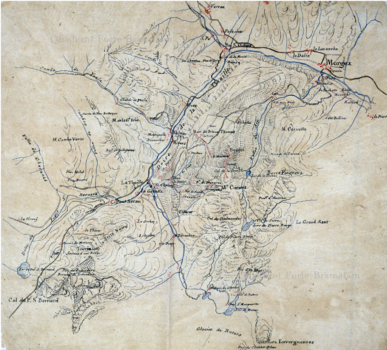
Carta dei trinceramenti della conca di La Thuile. BRT Ms

Sarebbe interessante un'analisi comparata dei vari manoscritti per avere una possibile versione completa, considerando anche le variazioni di grafia (esempio da Chiampouërcier a S. t Pourciers ).