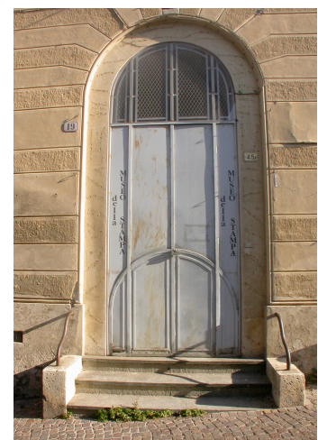
Ospedale Vecchio di Rivoli, lato di Via Ospedale con l'ingresso al fu Museo della Stampa, accesso alla galleria del chiostro.